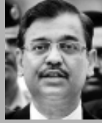
उज्ज्वल निकम विशेष सरकारी वकील महाराष्ट्र राज्य