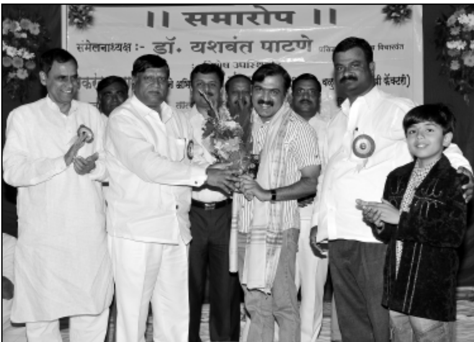
बाणेर उपनगरीय साहित्य संमेलनात अभिनेते मकरंद अनासपुरे यांचा सत्कार करताना.